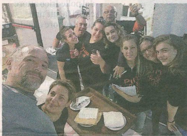
I volontari della sagra che si svolge da domani al Rivana Garden